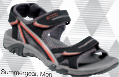
Summergear, Men Str.: 40-47 · 649 kr.

Så hvis man vil prøve at sejle joller, er det bare om at møde op i enten Vallensbæk Sejlklub, Brøndby Strand Sejlklub eller SKB Hundige den 5. juni fra klokken 12.