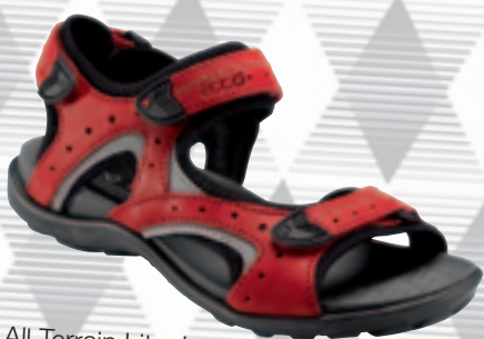
All Terrain Lite, Ladies Str.: 36-42 · 749 kr.