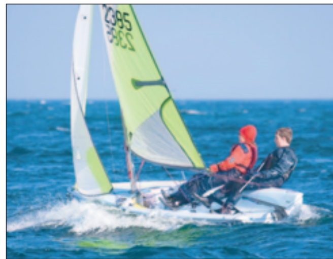
Sejlklubberne holder åbent hus på fredag 5. juni.

- Derfor er der plads til både den 8-årige begynder, som skal ud i en Opti eller Tera og den 14-årige knægt på 70 kilo, som skal ud og sejle vildt i en Hobbie Cat 16,