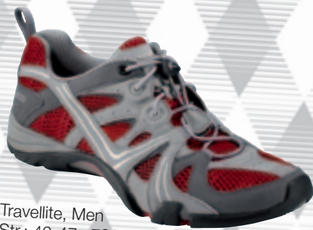
Travellite, Men Str.: 40-47 · 799 kr.