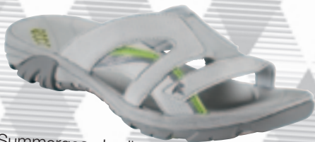
Summergear, Ladies Str.: 36-42 · 599 kr.